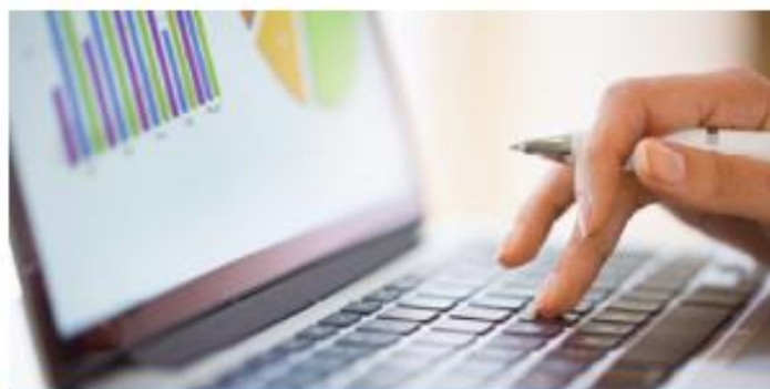
Dati e statistiche