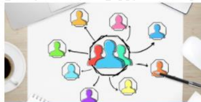
Attori dell'Assicurazione Qualità