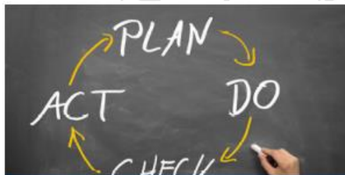
Qualità in azione