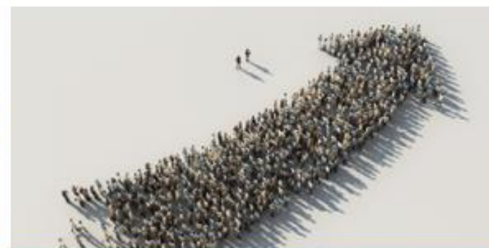
Qualità in crescita: eventi e formazione