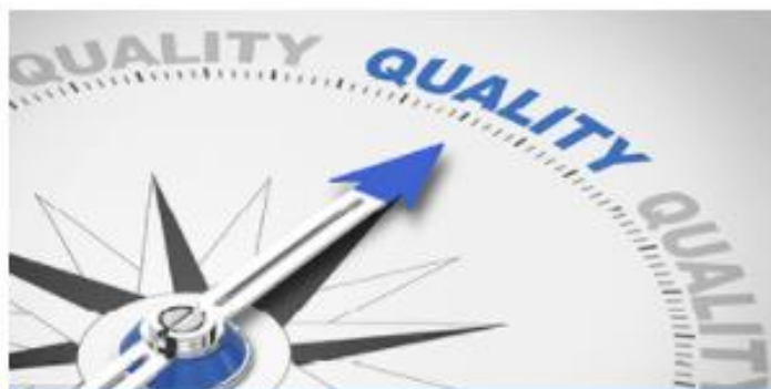
Il sistema qualità